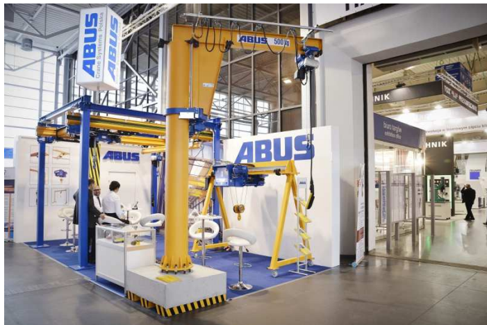
Stoisko ABUS na ITM 2014

Obecnie ABUS jest jedną z najbardziej rozpoznawalnych globalnie marek dźwignic przemysłowych. Dbając o potrzeby klienta, koncentruje się przede wszystkim na dostarczaniu produktu niezawodnego i trwałego. Pomimo obecności urządzeń ABUS na całym świecie, najważniejszych inwestycji dokonano jedynie na kluczowych rynkach. W Europie poza Niemcami ABUS posiada spółki we Francji, Wielkiej Brytanii, Holandii, Szwecji i Hiszpanii oraz oczywiście w Polsce. Polska jest jedynym krajem tzw. nowej Unii, w którym ABUS zainwestował, a zakres tej inwestycji jest największy poza samymi Niemcami. Wskazuje to na fakt długofalowego zobowiązania firmy w stosunku do naszego rynku. Z tego też względu ABUS Crane Systems Polska był obecny na tegorocznych targach ITM w Poznaniu. Targi Innowacje Technologie Maszyny są największą tego typu imprezą w Europie Środkowo-Wschodniej, o czym świadczy liczba niemal 17 tys. zwiedzających z 23 krajów.