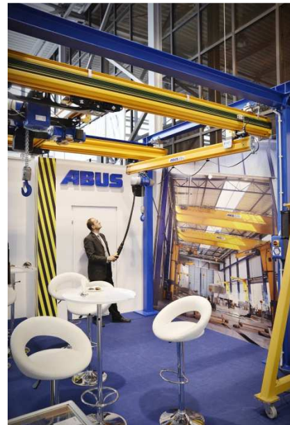
Praca suwnicy ABUS na ITM 2014

Odwiedzając stoisko ABUS, można było poznać urządzenia oferowane przez firmę. Ekspozowano suwnice podwieszane, żuraw warsztatowy, wciągarki łańcuchowe oraz wciągnik linowy typu E. Poza kompletnymi urządzeniami wystawiano komponenty oraz elementy układu sterowania.