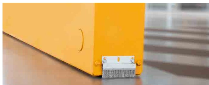
Koła nie wymagają szyny jezdnej